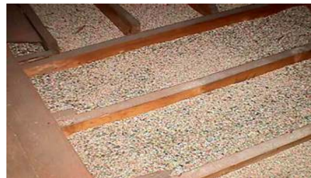
Aislante de vermiculita entre vigas en el ático