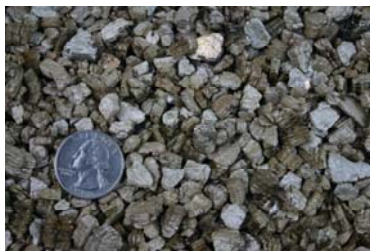
Aislante de vermiculita típica

Observe las fotos de este sitio Web y luego observe el material de aislamiento sin tocarlo. El aislante de vermiculita es como piedrecillas, es un producto que se vierte y usualmente es de color gris-café o plata-dorado.