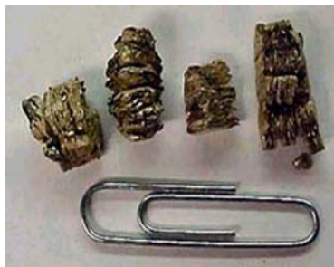
Tamaño de las partículas de vermiculita comparado con un clip de papel clip