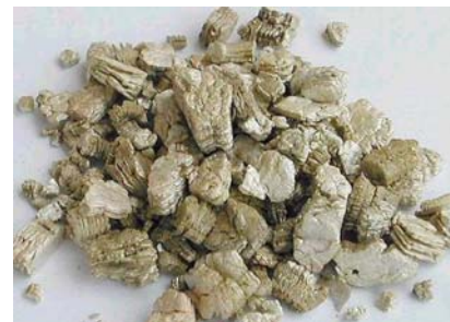
Aislante de vermiculita típica